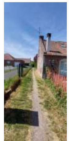
Prenez ce chemin et au bout à droite