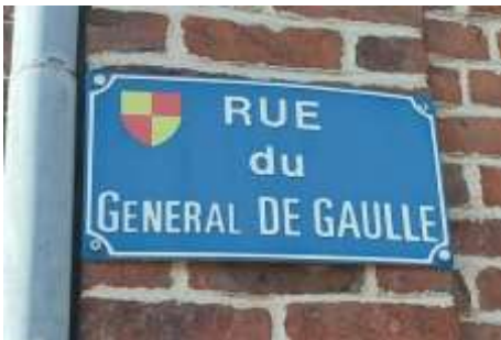
Avancez trottoir de gauche