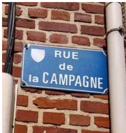
Dirigez-vous dans cette rue