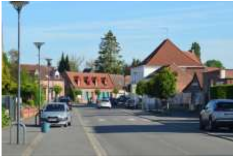
Avancez vers cette rue