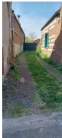
Cour ..... .....