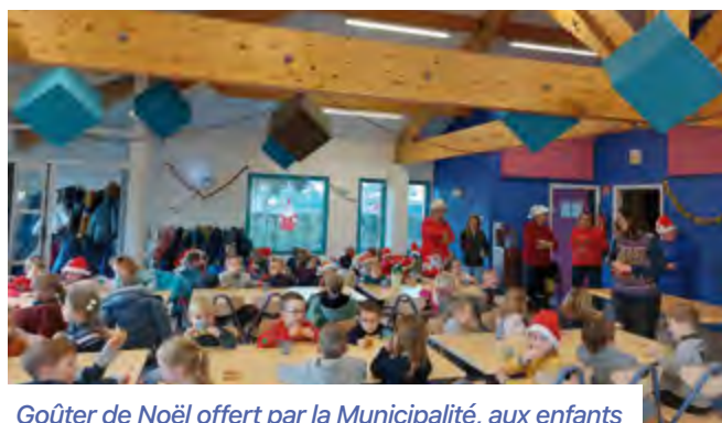
Goûter de Noël offert par la Municipalité, aux enfants de maternelle et de CP le 15 décembre 2022