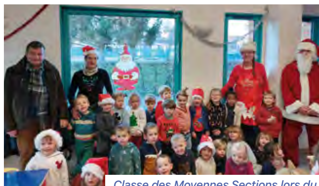
Classe des Moyennes Sections lors du goûter de Noël le 15 décembre 2022