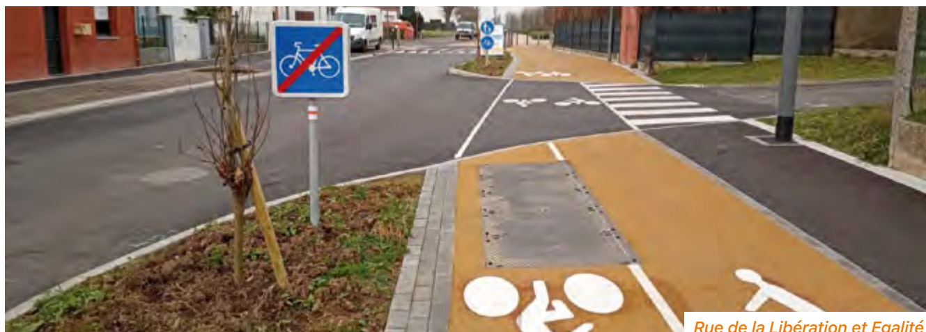
Rue de la Libération et Égalité

Pour la sécurité de tous, veuillez à emprunter le bon couloir de circulation.