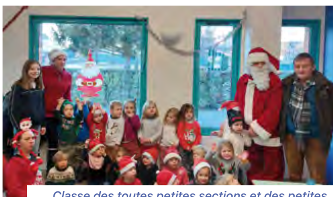
Classe des toutes petites sections et des petites sections lors du goûter de Noël le 15 décembre 2022