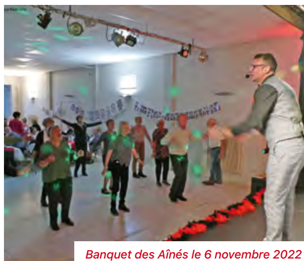
Banquet des Aînés le 6 novembre 2022