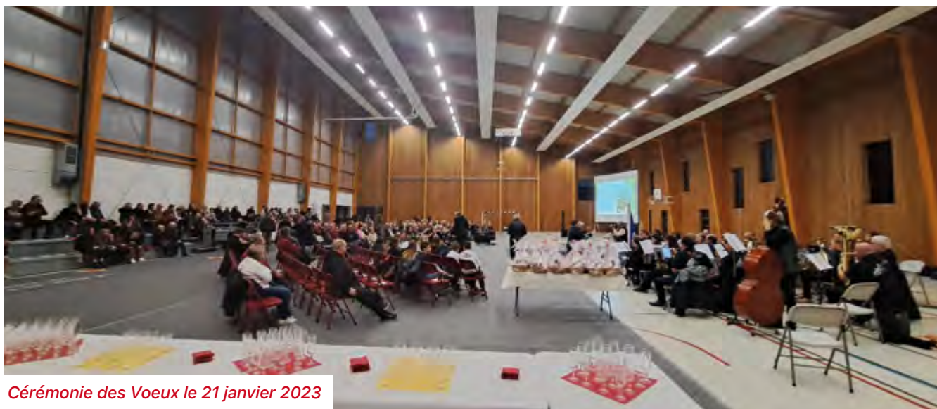
Cérémonie des Voeux le 21 janvier 2023