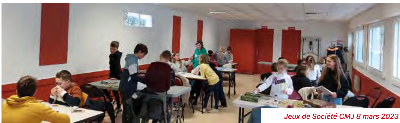
Jeux de Société CMJ 8 mars 2023