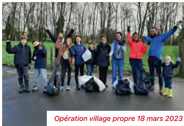
Opération village propre 18 mars 2023