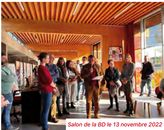
Salon de la BD le 13 novembre 2022