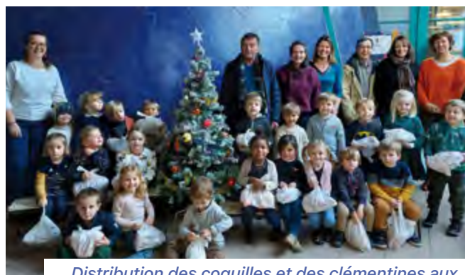
Distribution des coquilles et des clémentines aux enfants de l'école par les élus le 6 décembre 2022