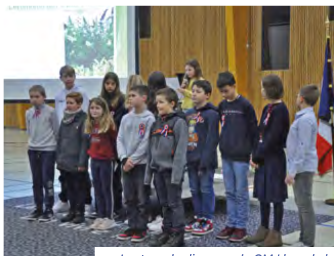
Lecture du discours du CMJ lors de la cérémonie des vœux le 21 janvier 2023