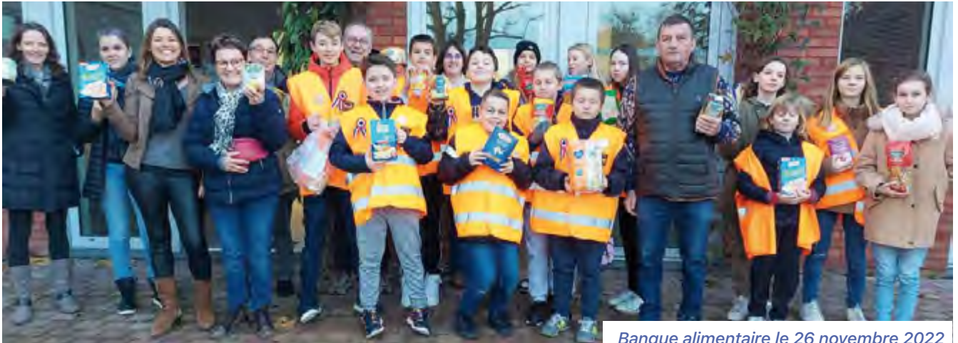
Banque alimentaire le 26 novembre 2022