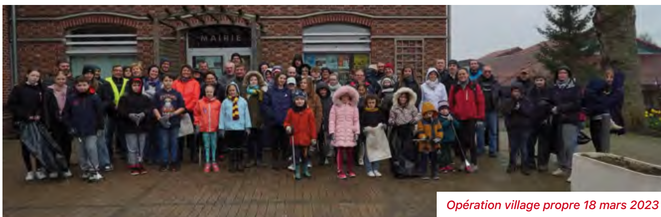
Opération village propre 18 mars 2023