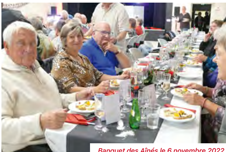
Banquet des Aînés le 6 novembre 2022