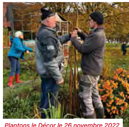
Plantons le Décor le 26 novembre 2022