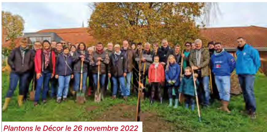
Plantons le Décor le 26 novembre 2022