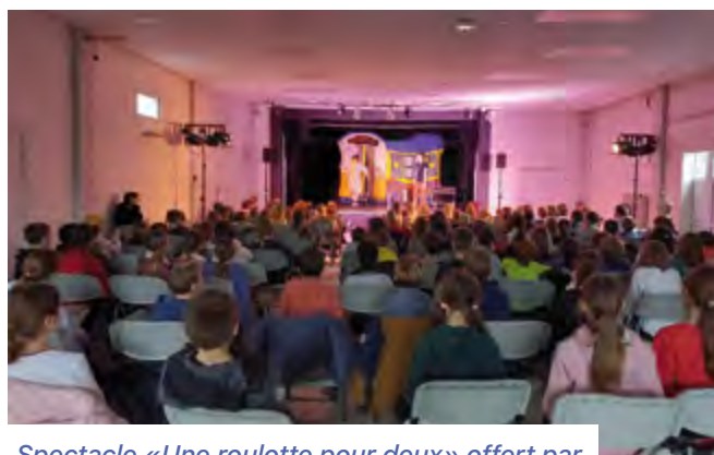
Spectacle «Une roulotte pour deux» offert par la Municipalité, le 1 er décembre 2022