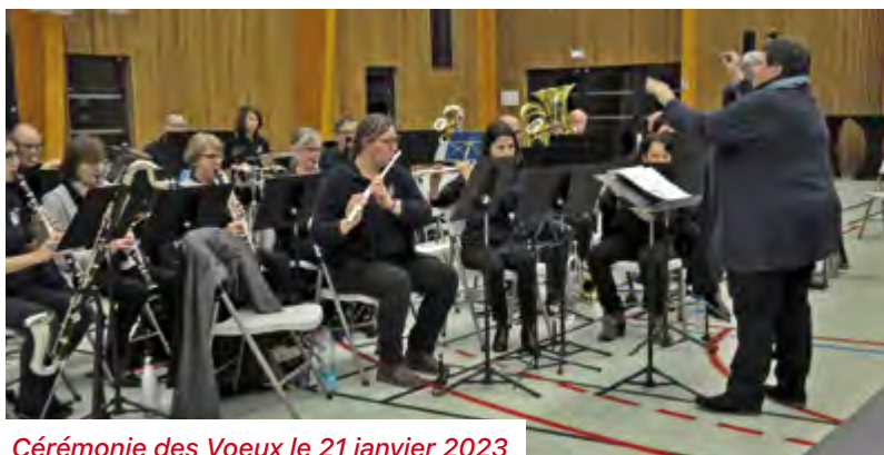
Cérémonie des Voeux le 21 janvier 2023