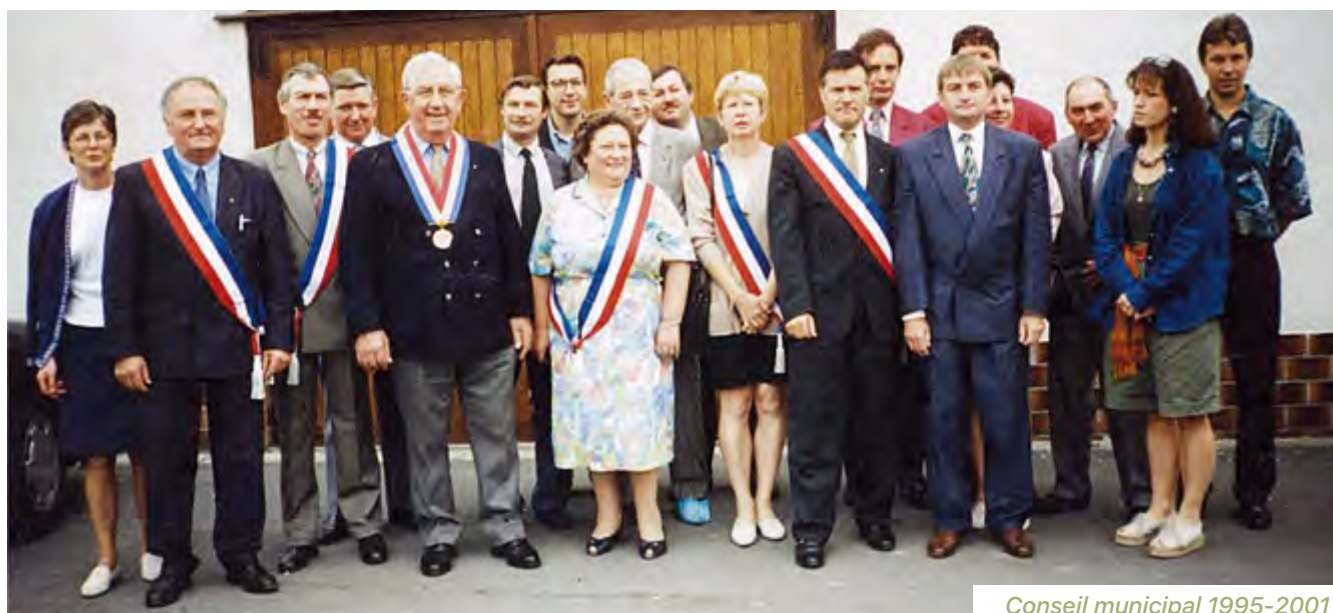
Conseil municipal 1995-2001