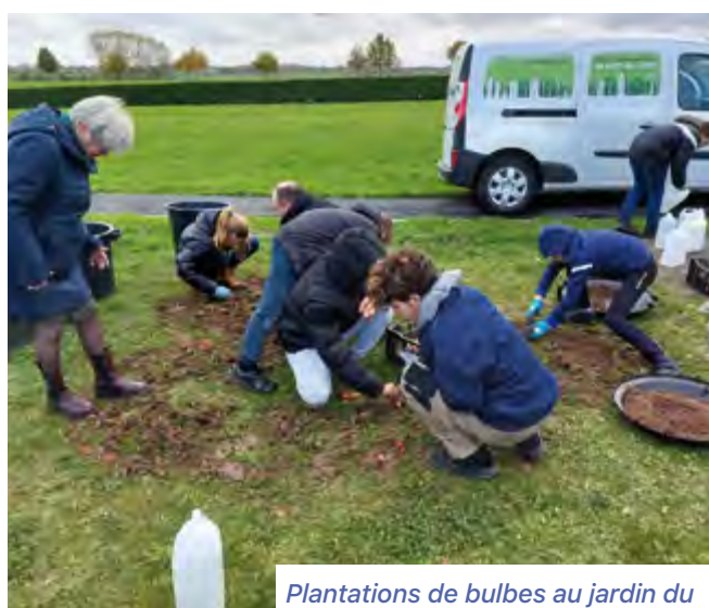
Plantations de bulbes au jardin de souvenir le 16 novembre 2022