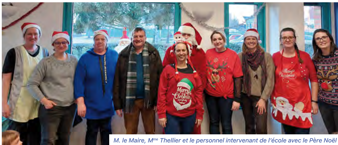
M. le Maire, M me Thellier et le personnel intervenant de l'école avec le Père Noël

Le réaménagement de la garderie est terminé, la salle « zen » est enfin accessible !