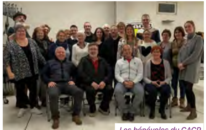
Les bénévoles du CACP