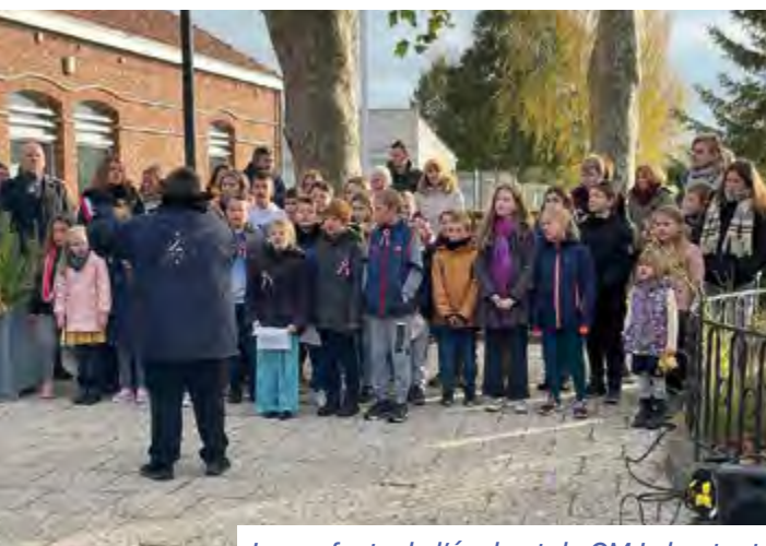
Les enfants de l'école et du CMJ chantent la Marseillaise le 11 novembre