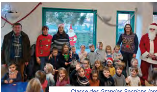
Classe des Grandes Sections lors du goûter de Noël le 15 décembre 2022

L'expo musée aura lieu le vendredi 9 juin 2023 et la fête de l'école le 1er juillet 2023.