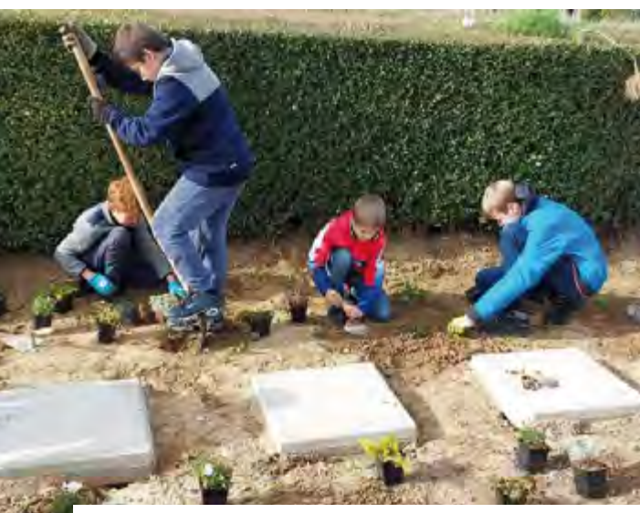
Plantations de vivaces au cimetière le 12 octobre 2022