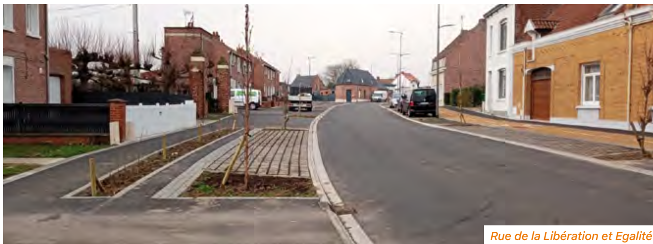
Rue de la Libération et Égalité

Les travaux d'enfouissement et de voirie des rues de la Libération et de l'Égalité sont terminés