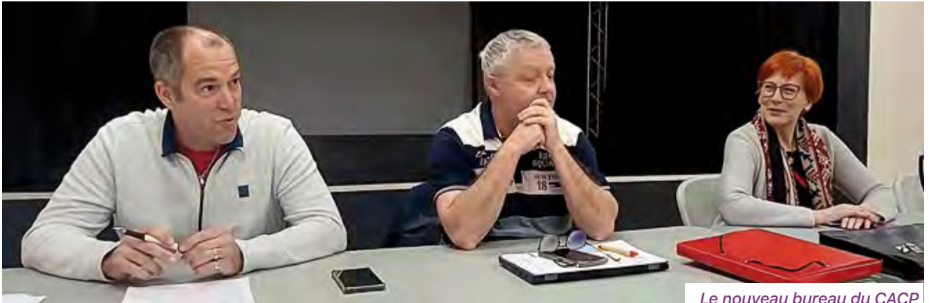
Le nouveau bureau du CACP