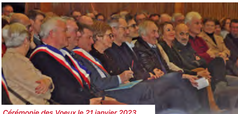
Cérémonie des Voeux le 21 janvier 2023