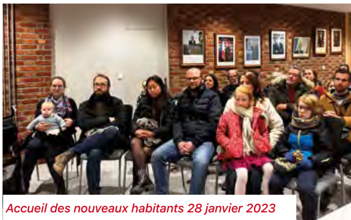
Accueil des nouveaux habitants 28 janvier 2023