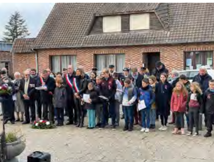
Lecture du discours du 11 novembre par le CMJ