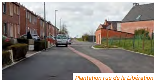
Plantation rue de la Libération

Les places de stationnement sont également engazonnées pour permettre l'infiltration des eaux de pluie.