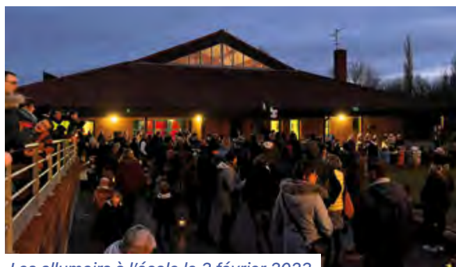
Les allumoirs à l'école le 3 février 2023