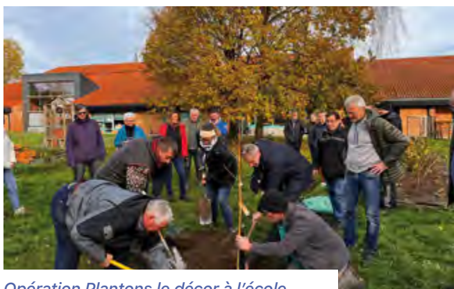
Opération Plantons le décor à l'école, plantation du poirier le 26 novembre 2022