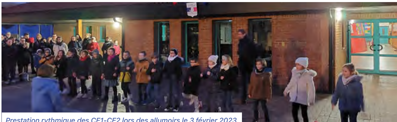
Prestation rythmique des CE1-CE2 lors des allumoirs le 3 février 2023