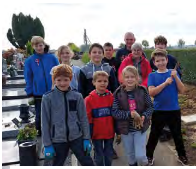
Plantations de vivaces au cimetière le 12 octobre 2022