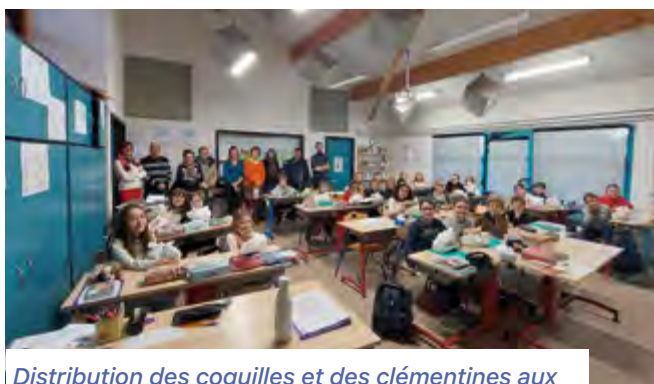
Distribution des coquilles et des clémentines aux enfants de l'école par les élus le 6 décembre 2022