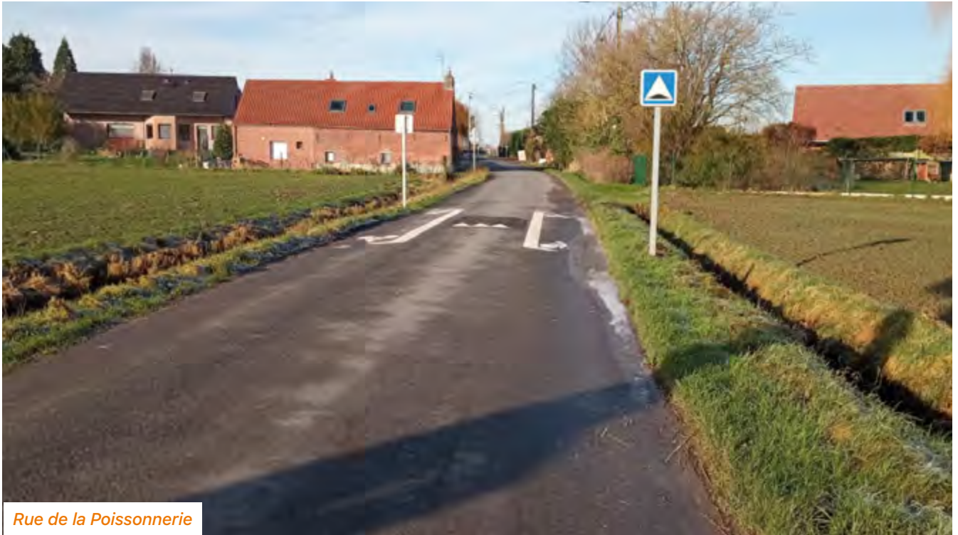
Rue de la Poissonnerie