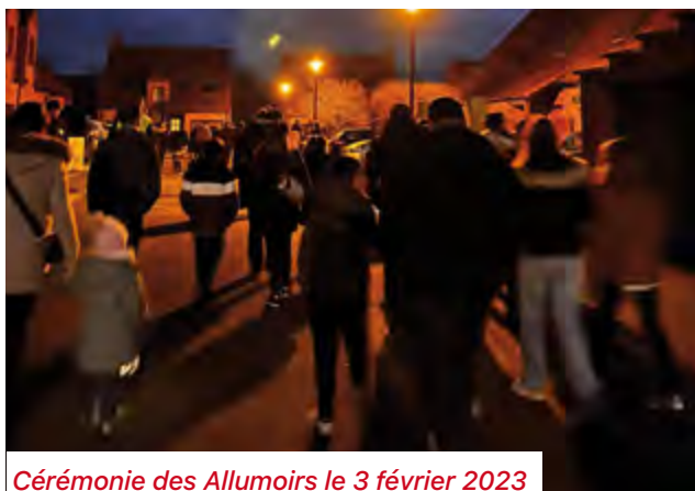
Cérémonie des Allumoirs le 3 février 2023