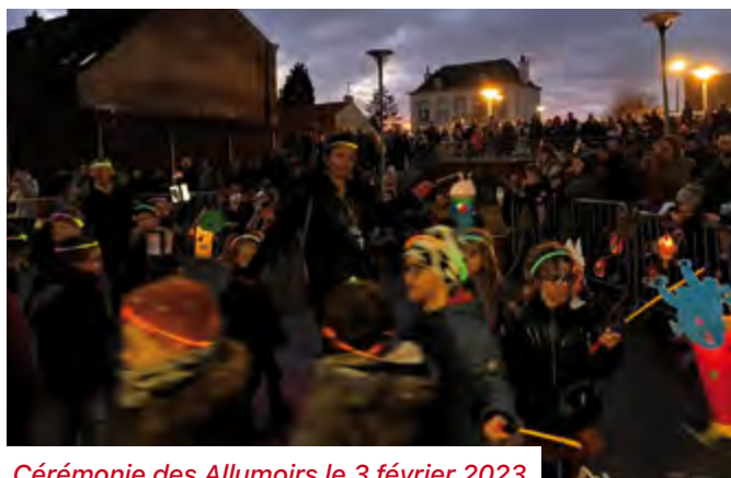
Cérémonie des Allumoirs le 3 février 2023